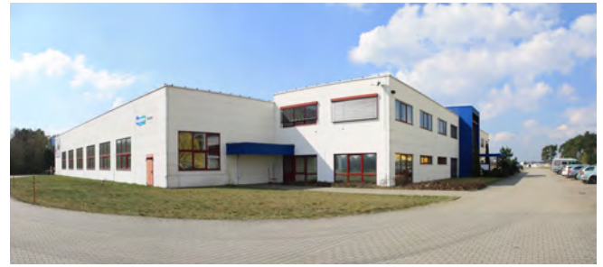
Doosan Logistics Europe (DLE), Germania